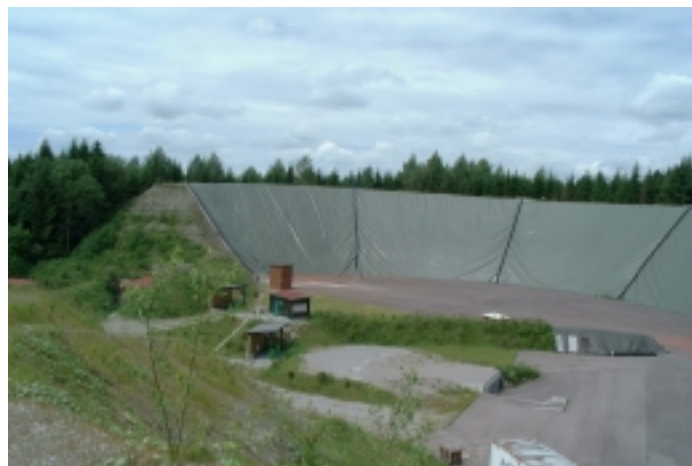
Abbildung 4: Wallanlage mit Folienabdeckung

Weiterhin wird derzeit erprobt, einen vorhandenen oder neu angelegten Wall mit Folie abzudecken (siehe Abbildung 4) und evtl. mit einer senkrecht zur Böschungsfläche angeordneten Abprallwand zu versehen. Dies bietet den Vorteil, dass sich Schrote und Wurfscheibenscherben am Grund der Anlage sammeln und bei entsprechender Befestigung der Grundfläche problemlos eingesammelt und auch getrennt werden können. Ein Eintrag von Blei und PAK in den Boden kann bei fachgerechter Ausführung nicht erfolgen. Bei Folie und Prallwänden besteht unter Umständen die Gefahr, dass Schrote als Rück- oder Abpraller die Schützen gefährden oder die Wurfscheibenschießanlage verlassen.